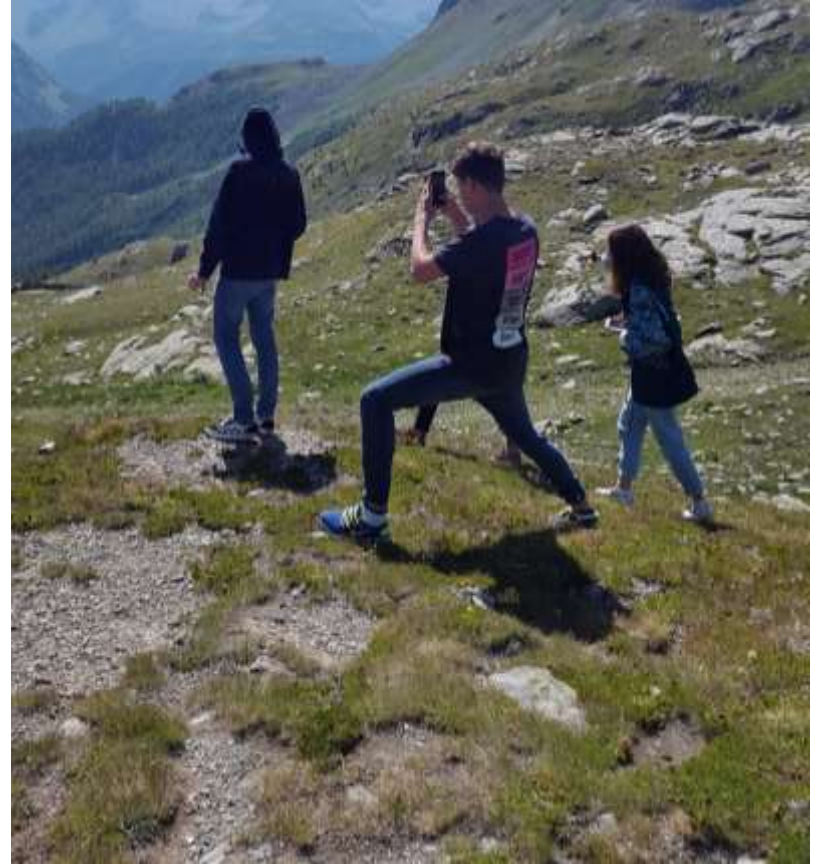
Berninapass – der Berg ruft